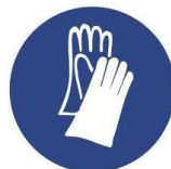
Protection des mains