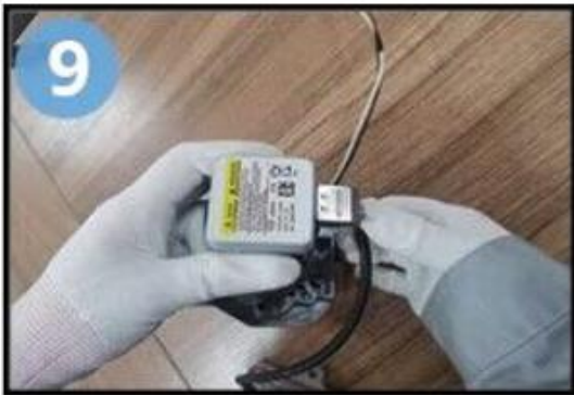
Insérez la fiche du ballast dans la douille de l'ampoule pour terminer l'installation