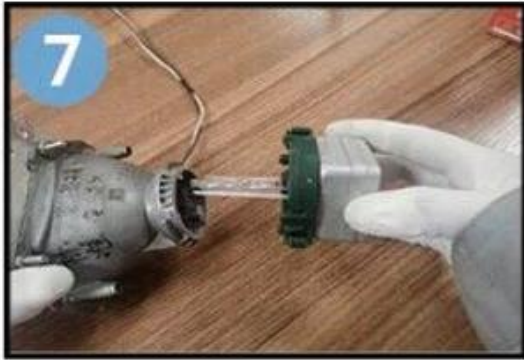
Insérez l'ampoule dans la lentille, maintenez le tube vers le bas