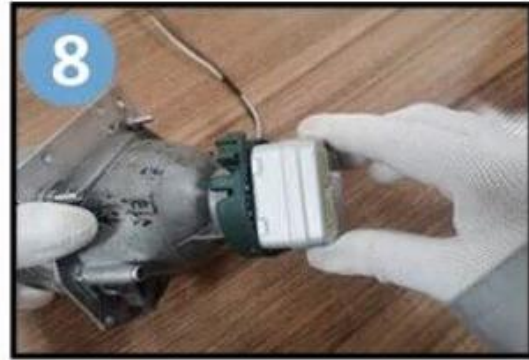
Tournez le support dans le sens des aiguilles d'une montre pour maintenir l'ampoule en place